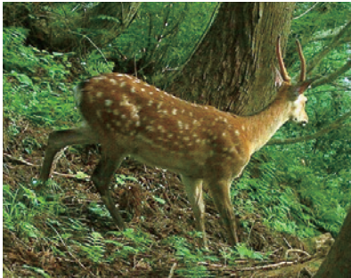
県内で分布を急速に広げるシカ

また、「なぜ野生動物と共存すべきか？」という、市民の多くが抱く素朴な疑問にこたえるべく、中型・大型の哺乳類が森林生態系にて果たす機能の解明に向けた基礎研究も進めています。